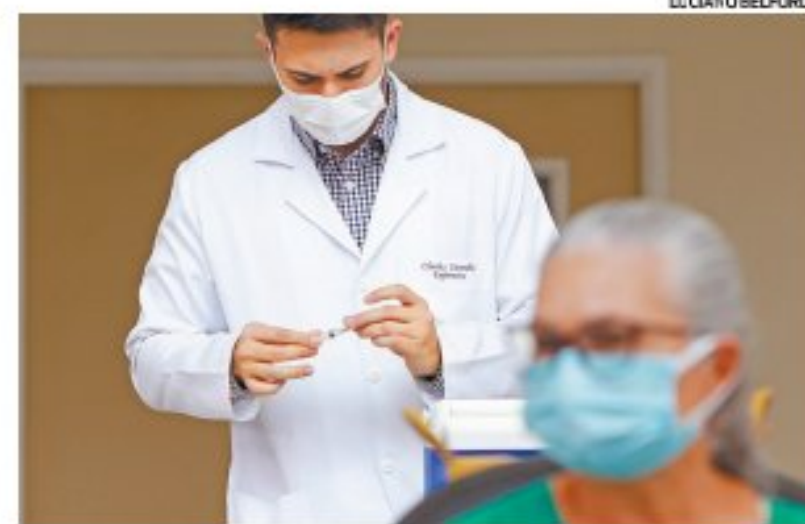
Ministério da Saúde orientou estados a usar novas remessas

Segundo o Instituto, o desgaste diplomático entre Brasil e China atrapalhou a produção da vacina. O imunizante é feito com matéria-prima importada do país asiático, que demorou para chegar ao Brasil.